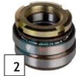
2 Etuhaarukan mukana tulee tuke-ohjauksen laakerit (kuva2). Laakerien asennukseen tarvitset