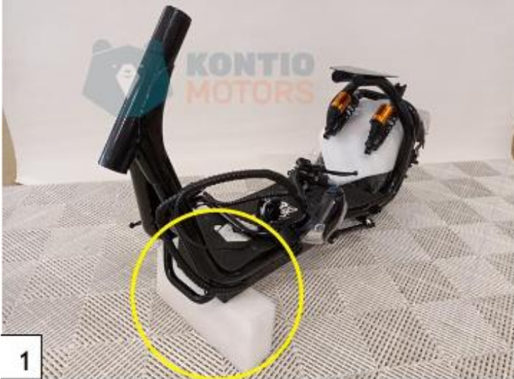
1 Nosta Kruiserin etupää pukin tai muun korokkeen päälle vasti. (kuva1)

Käytä kasauksessa käsityökaluja , ettei kiinnitysosat kiristy likaa tai kiinnityskohdat vaurioidu.