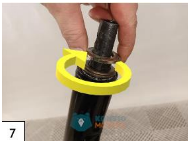
Aseta laakerin kiristysmutteri paikalleen. (kuva7)