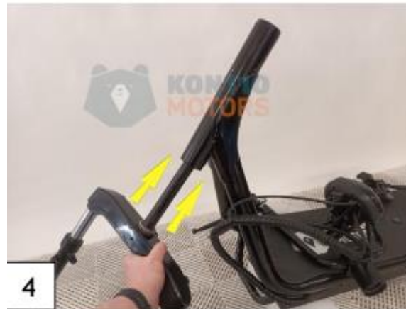
4 Aseta etuhaarukka paikalleen laitteen runkoputkeen kuvan mukaisesti. (kuva4)