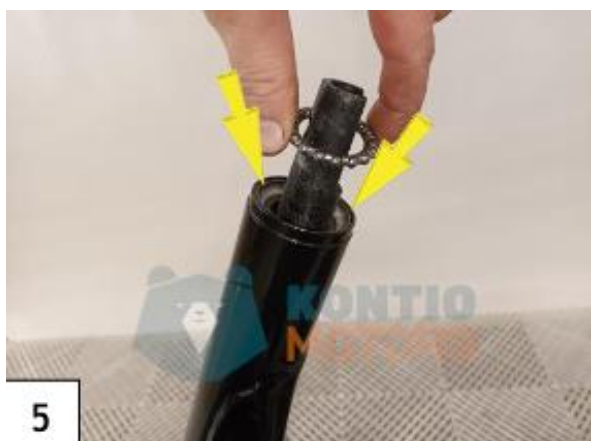
Laita etuhaarukan ylempi laakeri paikalleen. Muista voidella laakeri laakerivaseliinilla. (kuva5)