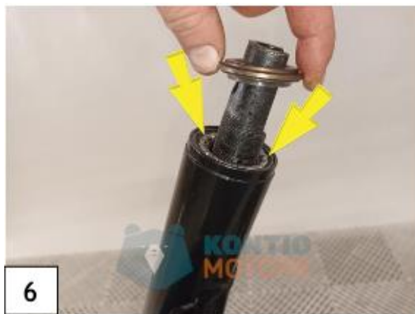
Laita etuhaarukan ylemmän laakerin yläkooli paikalleen. (kuva6)