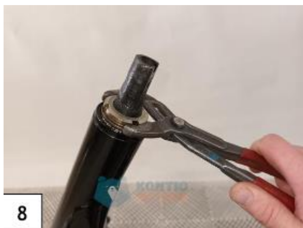
Kiristä ohjauslaakereiden kiristysmutteri sopivalle tiukkuudelle. (kuva8)

Liikuta etuhaarukkaa edestakaisin vasemmalta oikealle samalla kun kiristät ohjauslaakeria. Etuhaarukan tulisi kääntyä herkästi mutta laakereihin ei saa jäädä välystä. Jos etuhaarukassa alkaa tuntua vastusta, on laakeri liian kireällä.